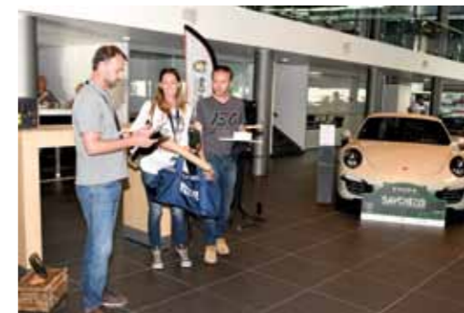
La traditionnelle remise des prix aux vainqueurs du quiz au Centre Porsche d'Annecy