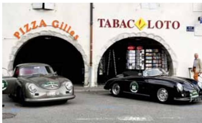
Elles ont de l'allure, ces 356!

Une quinzaine d'équipages, pour beaucoup venus d'assez loin, ont ainsi pu passer une agréable soirée en compagnie des organisateurs. Ce qui a aussi permis à ces derniers d'avancer sur le stickage des voitures et les formalités administratives, toujours contraignantes. Il faut saluer au passage le travail des très nombreux bénévoles du Club Porsche Pays de Savoie qui ont œuvré en amont et pendant la