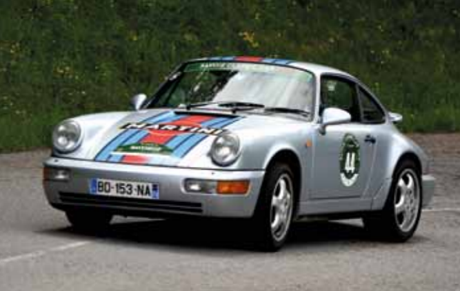
Ca ne traîne pas dans la montée de la Ramaz!