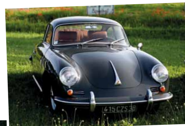
Une des six 356 présentes, celle-ci de 1963 est slate grey