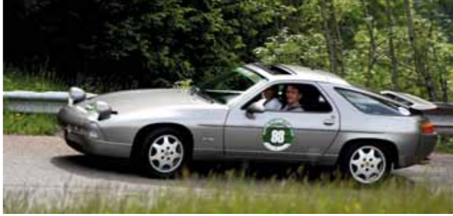
L'unique (belle) 928 du plateau

Quoi qu'il en soit l'ensemble du parcours était déjà assez