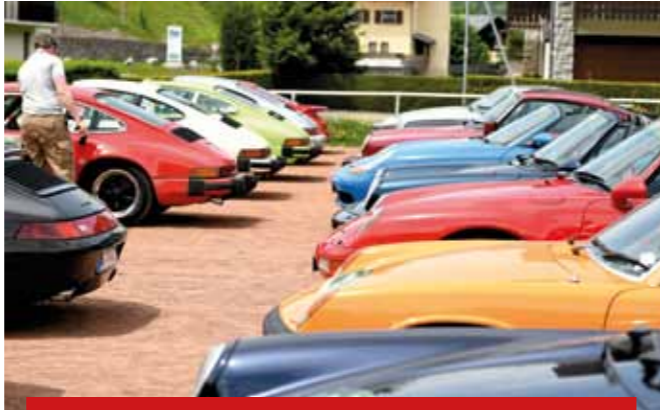
Qui a dit que les Porsche étaient toutes noires ou grises?

dense, varié et pittoresque pour que chacun rentre chez soi le soir avec de très beaux souvenirs, en se promettant de revenir l'année prochaine pour sillonner d'autres belles routes de cette région, tellement propice au roulage de nos Porsche. Elles ont encore montré, lors de cette 6 ème édition, leurs extraordinaires fiabilité et qualités routières.